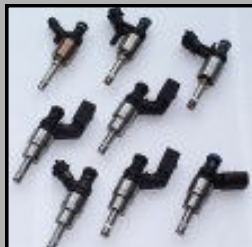
Iniettori & pompa sistema GDI BOSCH