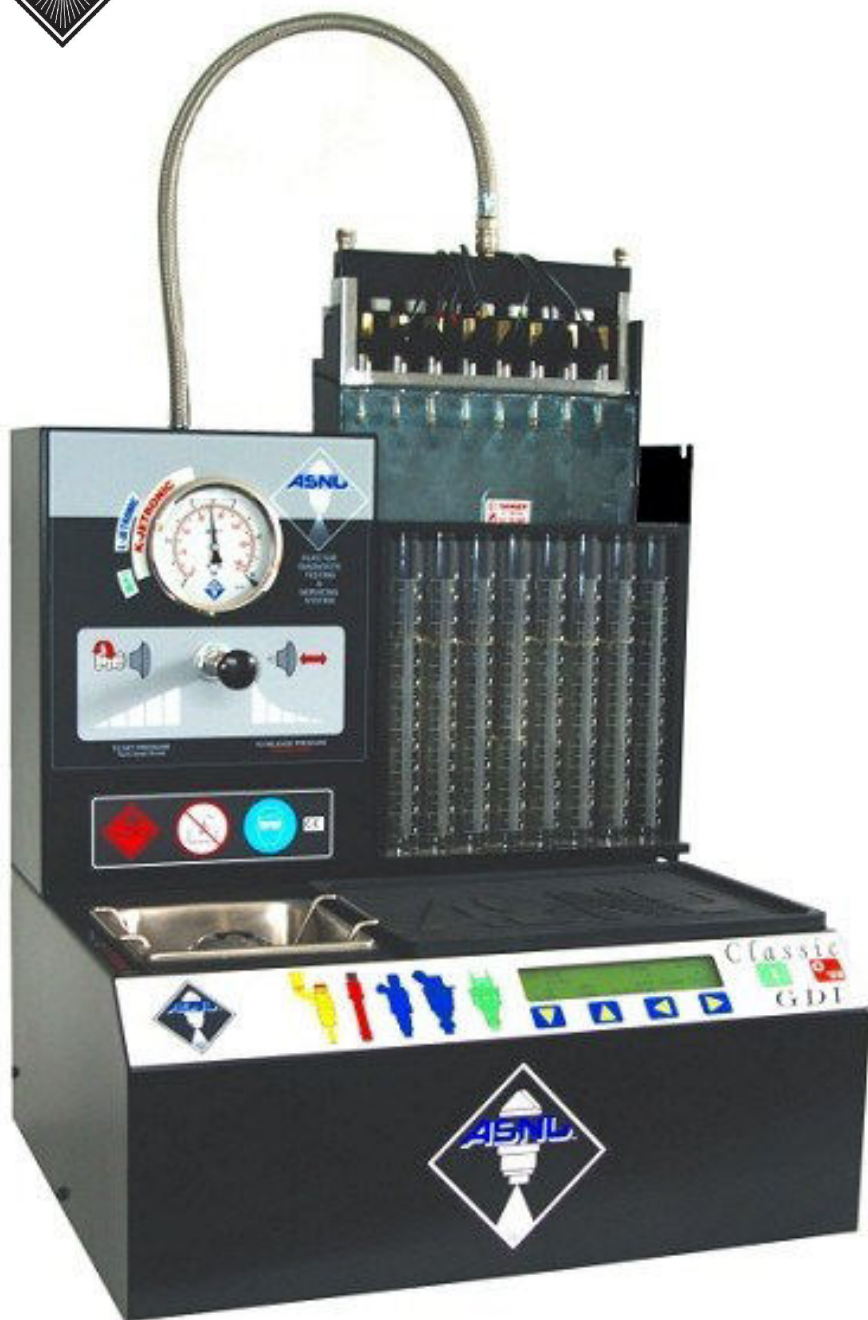
Top & Side Feed