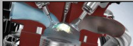
La camera di combustione GDI

GDI = Mitsubishi Peugeot Citroën, Hyundai, Volvo, (Gasoline Direct Injection)