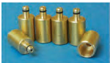
ADATTATORI BOSCH (6)