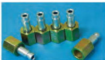
ADATTATORI SIEMENS (6)